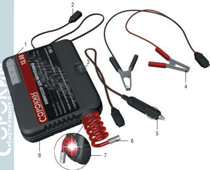
Рисунок 2 – Общий вид изделия