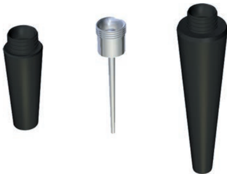
Рисунок 1 - Комплект переходников

ВНИМАНИЕ! Распаковав изделие, убедитесь в наличии всех деталей, согласно комплекту поставки. При отсутствии или поломке какой-либо детали немедленно свяжитесь с продавцом.